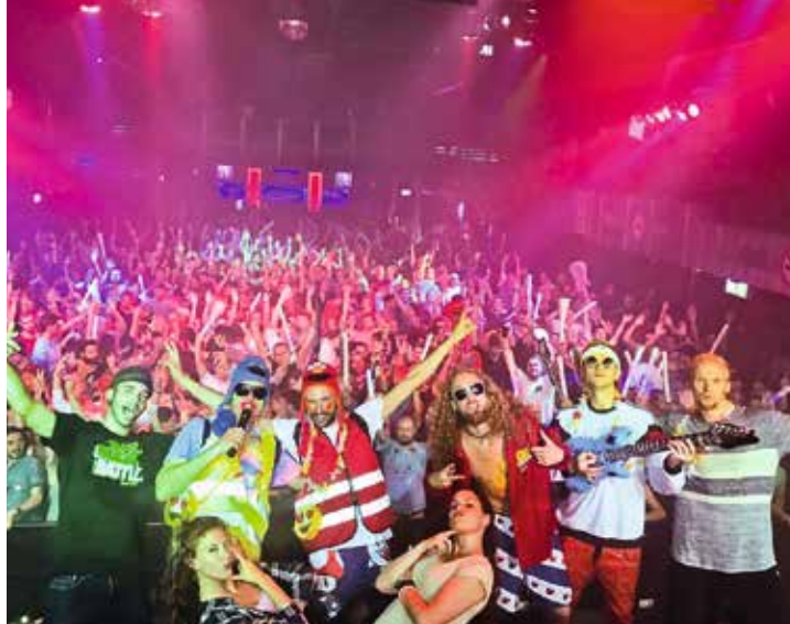
Für Freunde farbenfroher Fetzen: „Alles 90er“ in der Batschkapp

Die Schlange vor der Tür ist meist lang, die Tanzfläche dafür klein. Zu