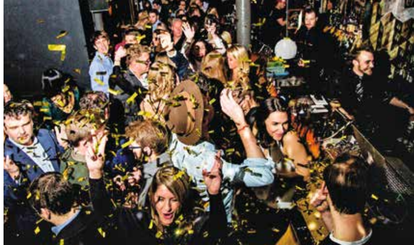
Ein bisschen Gold und Silber, ein bisschen Glitzer Glitzer im Chinaski